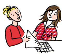
3. Mathe machen