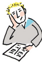
2. Englisch lernen