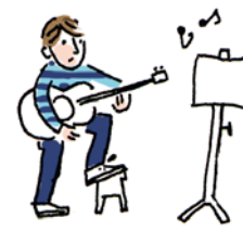
4. Gitarre üben

5 Ist das richtig r oder falsch f ? Kreuze an.